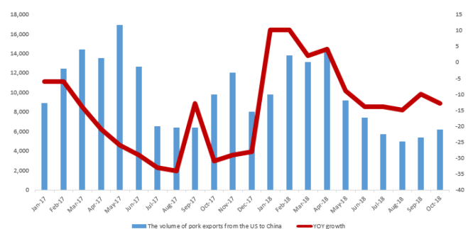
美国对中国出口猪肉量及增速